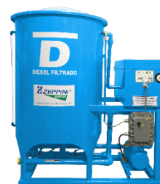
Filtro Prensa para Óleo Diesel - Super