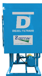
Filtro Prensa para Óleo Diesel - Pro